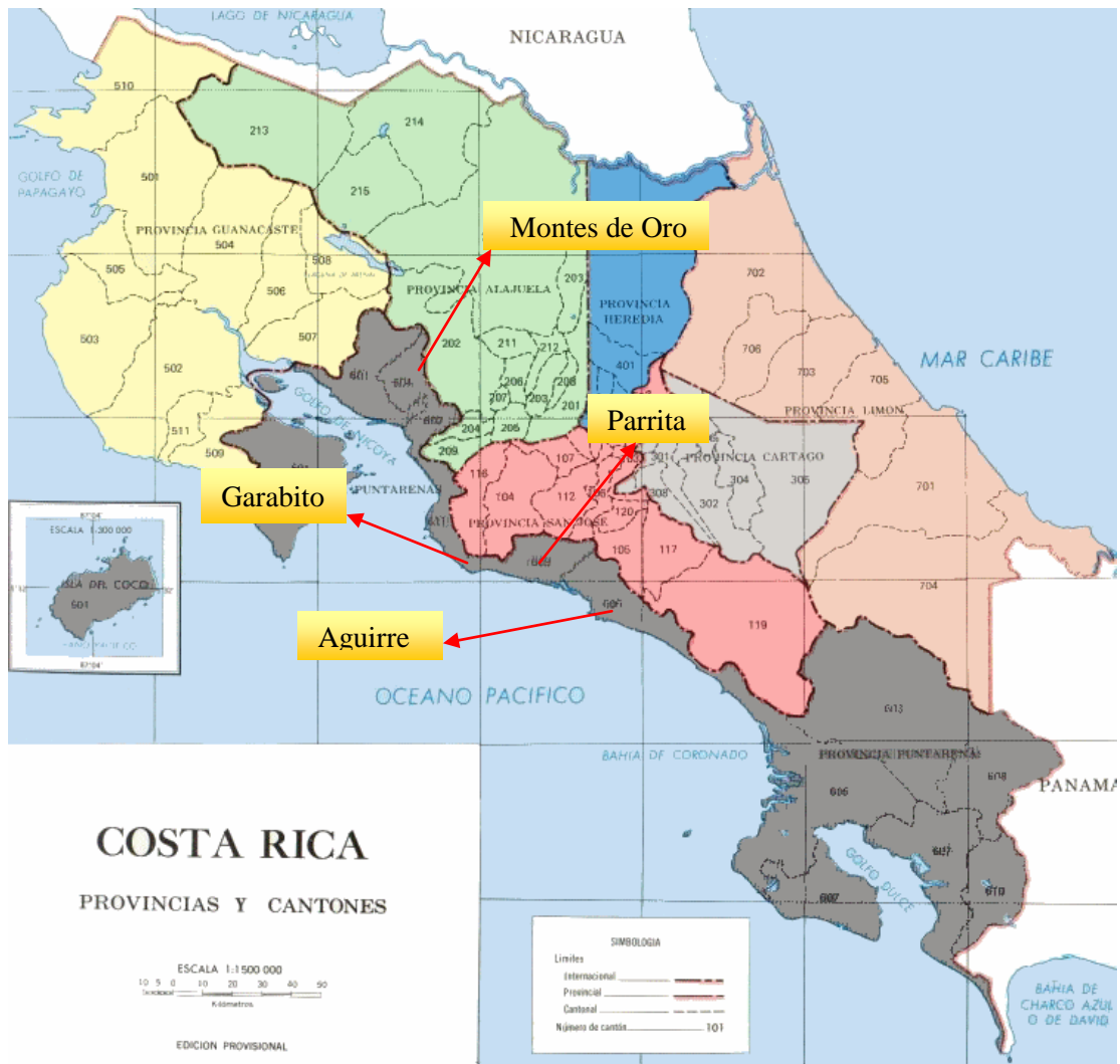
Detalle de la ubicación de los cantones en estudio dentro de la Geografía de Costa Rica.