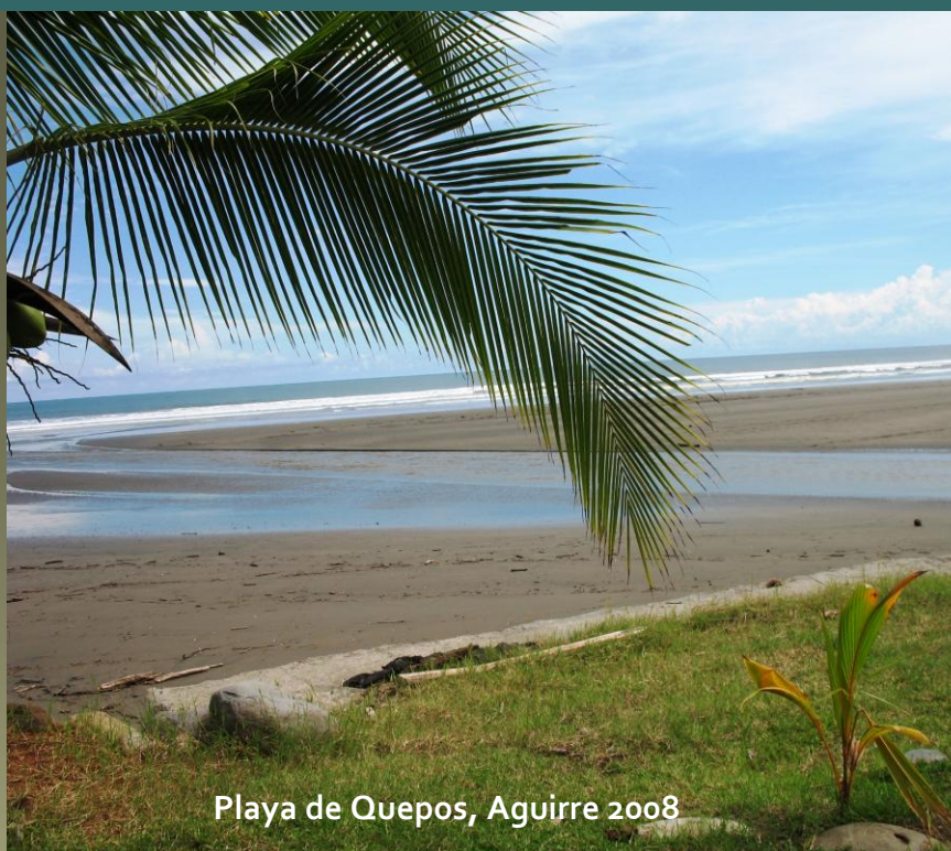
Playa de Quepos, Aguirre 2008